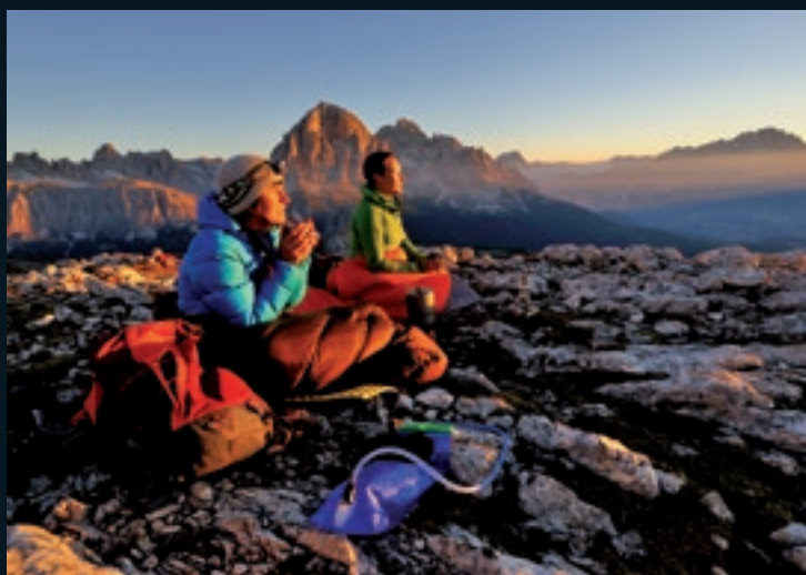
Sonnenaufgang (Ausschnitt)

Die Ausstellung „Der Berg ruft“ erzählt in einzigartigen Fotografien und ergreifenden Naturfilmszenen über die Faszination, die die Berge der Welt für uns Menschen haben. Sie zeigt die Dramatik der legendären Erstbesteigungen der berühmten Berggipfel der Erde. Gegenstand der Ausstellung sind aber auch die Heiligen Berge als jahrtausende alte Orte religiöser Verehrung.