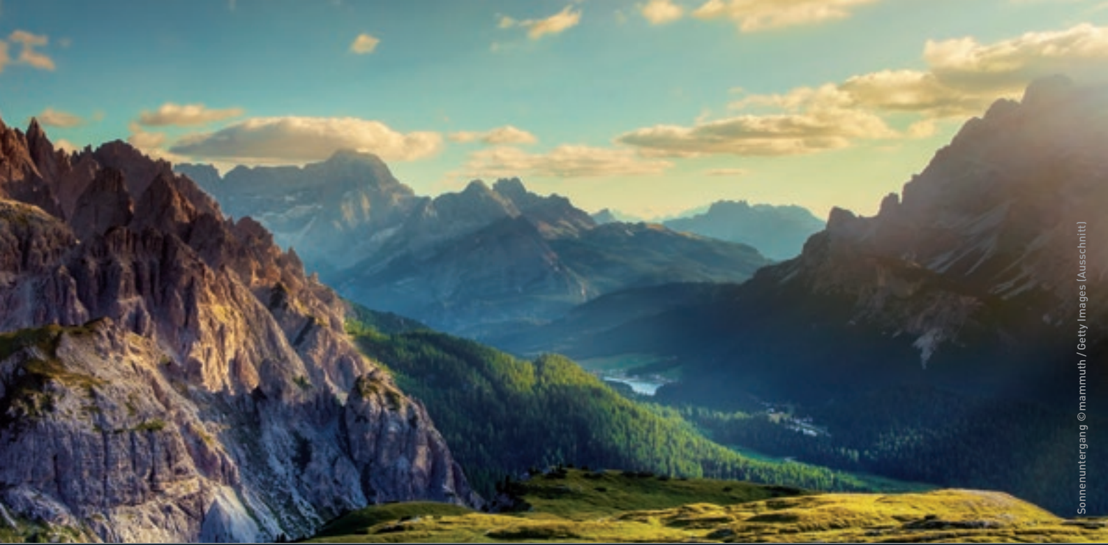
Sonnenuntergang (Ausschnitt)

Berge existieren nicht ewig. Sie entstehen in Millionen Jahren durch die Kollision der Erdplatten und werden durch die Kräfte der Erosion wieder zerstört. Faszinierende Fotografien und Filmszenen zeigen diesen ewigen Kreislauf des Gesteins und wie in Jahrtausenden in den gewaltigen Gebirgsmassiven der Erde einzigartige Lebenswelten mit einer eigenen Tier- und Pflanzenwelt entstanden sind. „Der Berg ruft“ ist eine Ausstellung des Gasometer Oberhausen in Zusammenarbeit mit dem Deutschen Zentrum für Luft- und Raumfahrt (DLR).