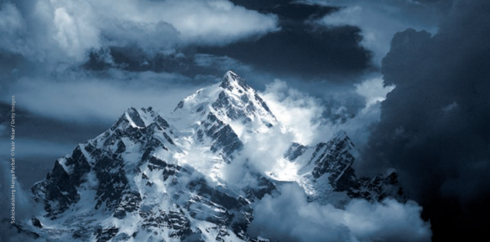
Schicksalsberg Nanga Parbat