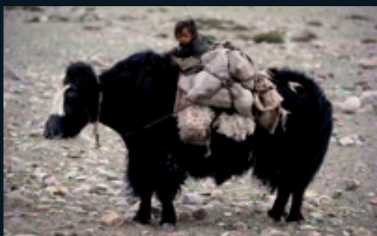
Nomaden am Kailash